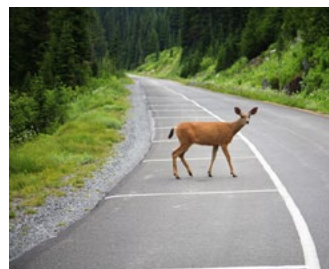
Střet se zvěří