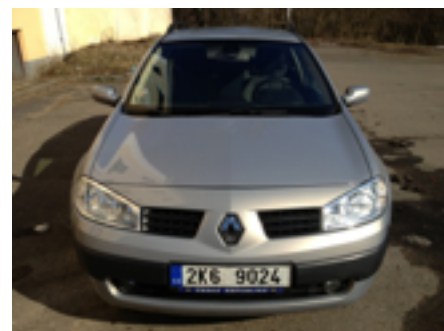
Zepředu celé čelní sklo. Musí být vidět SPZ.

Minimálně 3 barevné fotky. Fotit za dobrého světla, vozidlo musí být čisté. Lak karosérie, skla a SPZ musí být dobře viditelné. Okna nesmí být ani částečně stažená.