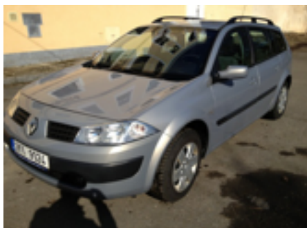
Šikmo zepředu na celý levý bok.