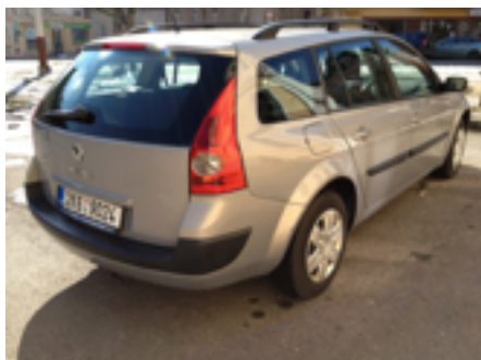
Šikmo zezadu na celý pravý bok.